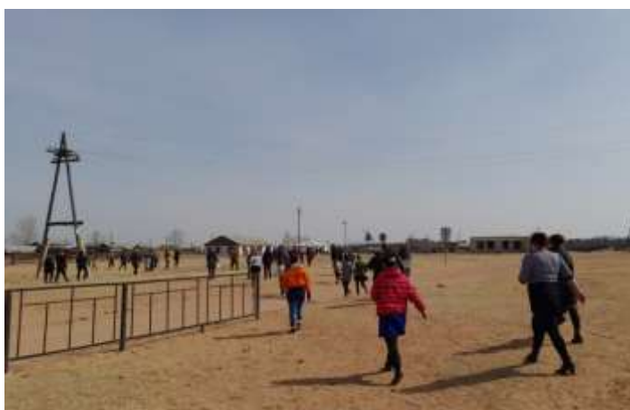
Движение к месту сбора