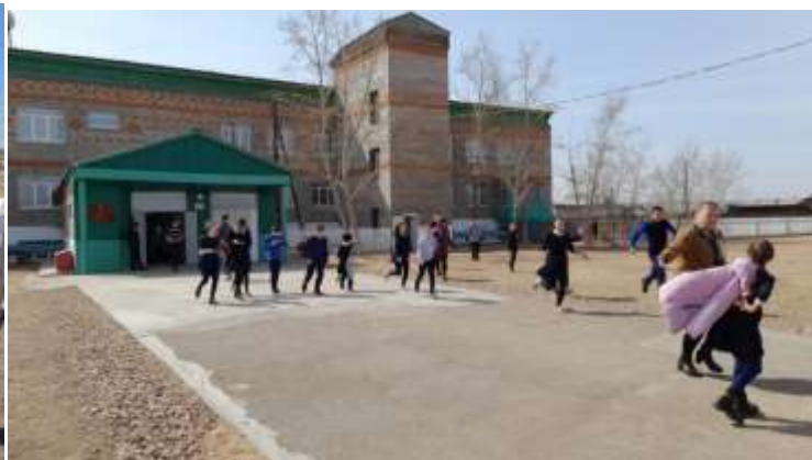
Эвакуация из здания школы