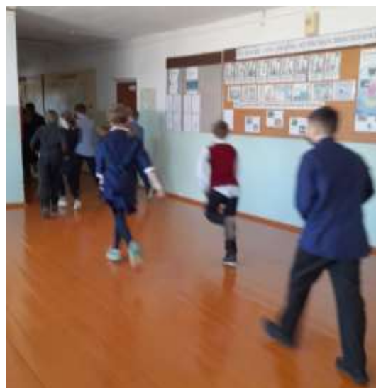
направляются к основному выходу 2 этажа